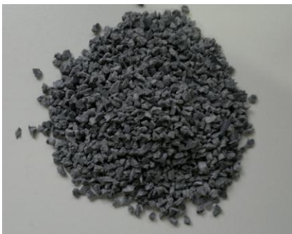
Mídia – Nat 1000

Com uma área superficial mínima de 1000 m 2 /m 3 e alto potencial de desenvolvimento de biofilme, a NAT- 1000 foi desenhada para uso na Tecnologia SNatural de IFAS (Integrated Fluidized Bed Activated Sludge) para reduzir DBO, nitrificar (NH 4 → NO 3 ) e denitrificar (NO 3 → N 2 ).