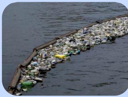
Barreira de Contenção para Lixo