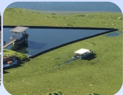
Barreira de Contenção em Estação de Captação de Água