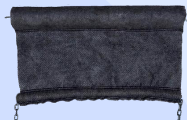
Modelos de Barreiras de Contenção