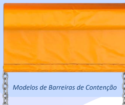
Modelos de Barreiras de Contenção

A barreira SNBar-00 são indicados para águas internas, tanto para contenção de lixo, plantas aquáticas e absorção de óleo.