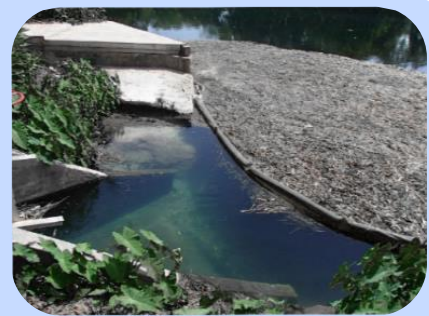
Barreira de Contenção em efluente