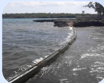
Barreira de Contenção para derrame de Óleo