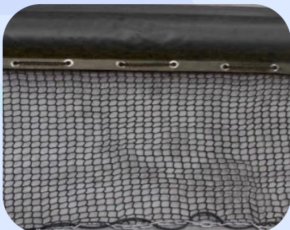
Detalhes da Barreira de Contenção para Peixes