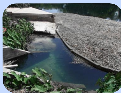
Barreira de Contenção em efluente