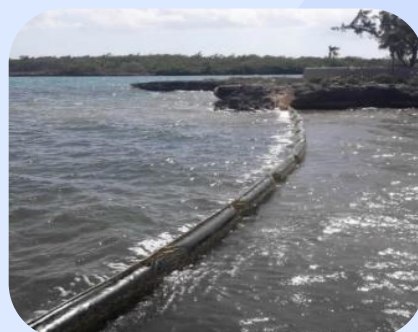
Barreira de Contenção para derrame de Óleo