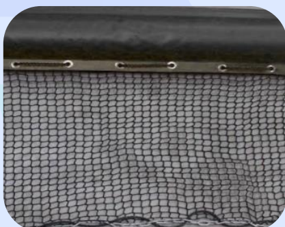
Detalhes da Barreira de Contenção para Peixes