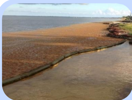
Barreira de Contenção no Mar