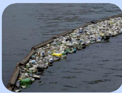
Barreira de Contenção para Lixo