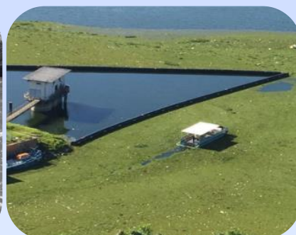
Barreira de Contenção em Estação de Captação de Água