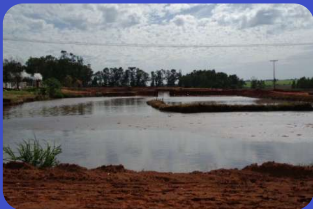
Antes do Tratamento