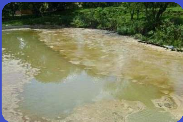
Antes do Tratamento