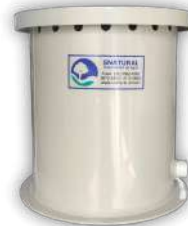
FILTROS DE AR