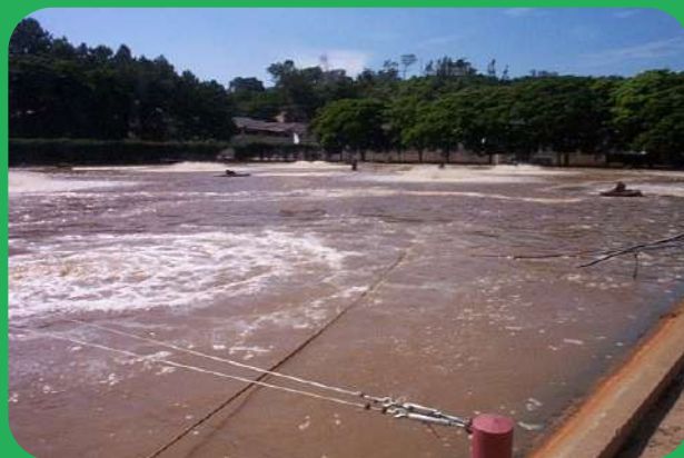
Depois do Tratamento