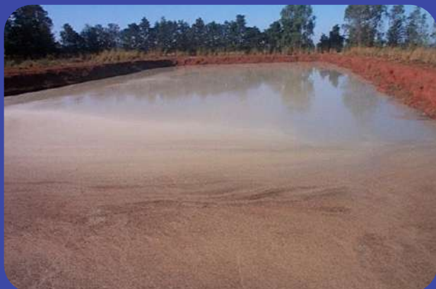
Antes do Tratamento