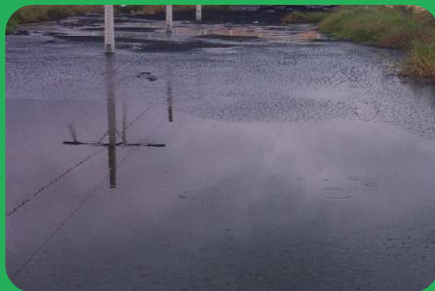
Depois do Tratamento