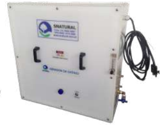
GERADOR DE OZÔNIO