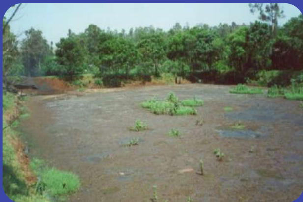
Antes do Tratamento