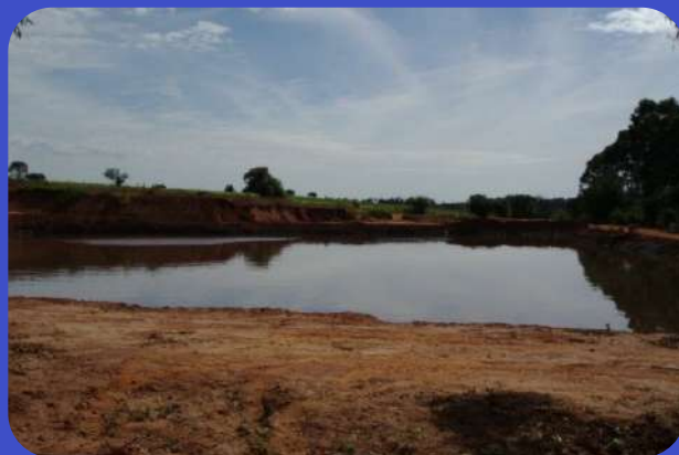
Depois do Tratamento