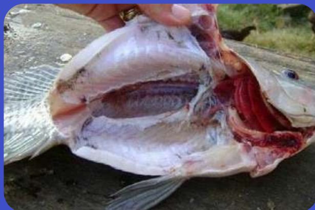
Depois do Tratamento

O lago apresentava lodo sobrenadante e no fundo em excesso. Lodo em excesso reduz drasticamente a oxigenação e a vida, reduzindo o aproveitamento da ração. (Cerca de 25% é perdido no fundo do lago misturado ao lodo)