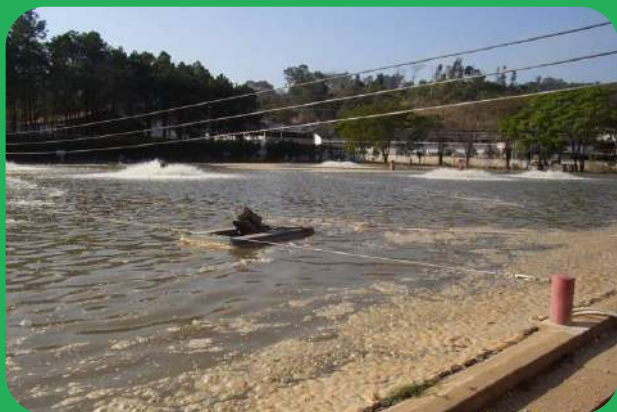
Antes do Tratamento