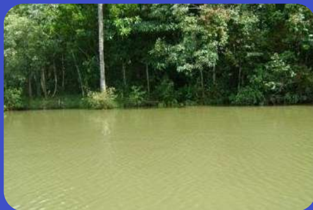
Depois do Tratamento

O Tratamento do Pesqueiro foi realizado no período de um ano, com aplicações quinzenais. Aplicando 1kg de BIOMAX para cada hectare de espelho d'água e 1m de lodo de fundo.