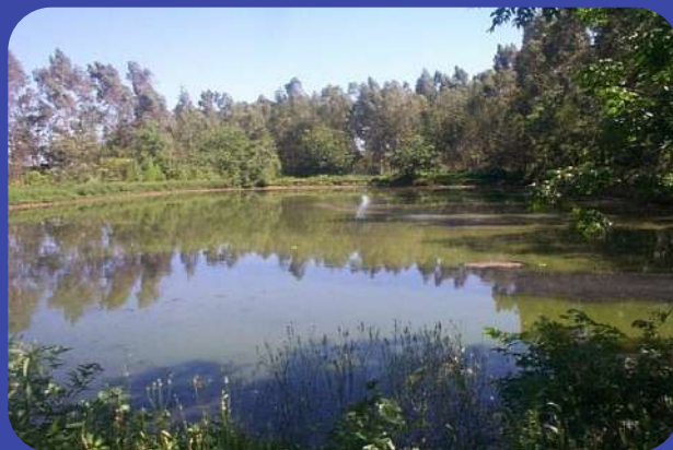
Depois do Tratamento