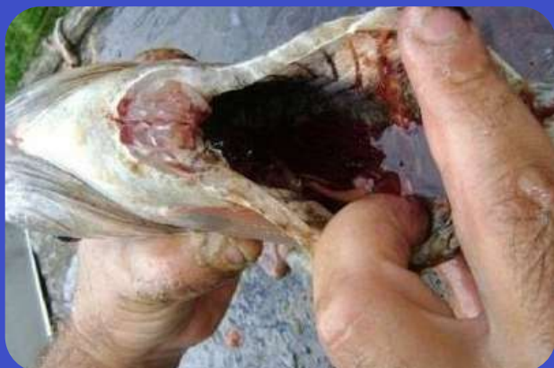
Antes do Tratamento