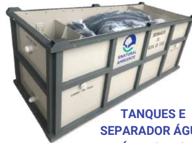
TANQUES E SEPARADOR ÁGUA ÓLEO (SAO)