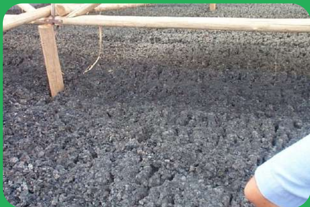
Antes do Tratamento