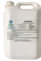
PRODUTOS QUÍMICOS E BIOLÓGICOS