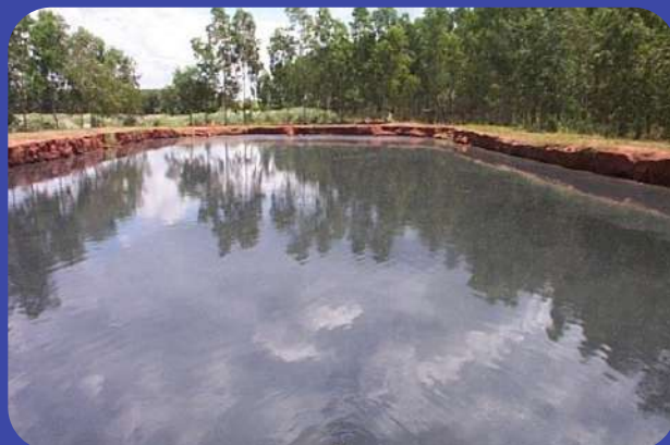
Depois do Tratamento